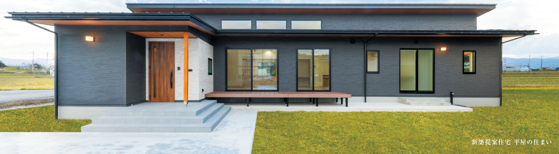
新築提案住宅 平屋の住まい